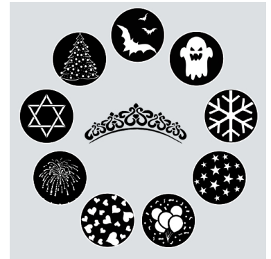
Inklusive 10 Gobos